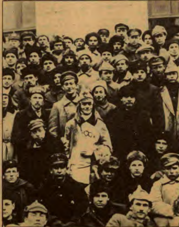
Voroshilov'la birlikte RKP(B)'in 10. Kongresine katılan delegelerle. Moskova, 22 Mart 1921

Leninci siyaset ilkeleri ışığında, Türkiye devrimci proletaryasını hegemonyasını yaşama geçireceğiz. Leninci ilkelerin evrensel geçerliliğini Türkiye'de devrim ile bir kez daha kanıtlayacağız.