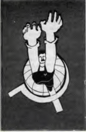
Kenan Aydın, Ankara

Türkiye işçi sınıfı burjuva yasak zincirini 51 yıllık bir aradan sonra parçaladı ve 1 Mayıs'ı 1976'da şanına yaraşır bir biçimde İstanbul 1 Mayıs Alanı'nda 500.000 kişilik bir gösteriyle kutladı. 77-78'de aynı bilinç ve coşkuyla daha da bilmiş ve çelikleşmiş olarak ve diğer emekçileri, devrimci güçleri de arkasına alarak 1 Mayıs Alanı'na çıktı. Devrimci yetenek ve öncülüğünü dosta düşmana gösterdi.