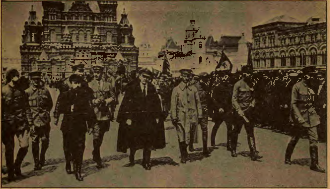
Kızıl Ordu'yu teftiş ederken. Moskova, Mayıs 1919

arak kurulacağı düşüncesiyle yanılığa düşmeyin! Demokratik sosyalist reformlar partisi olmak daha iyidir. Menşevikler ise şöyle diyorlar: 'Yalnızca proletarya ve küçük burjuvazinin devrimci kesimi (en başta köylüler) bizim devrimimizin gerçek utkusundan yanadırlar. Fakat orta burjuvazi ve ordu subayları, vb. liberaller tarafından önerildiği gibi monarşinin sınırlandırılmasından yanadırlar. Bu nedenle ayaklanmanın bir organı olarak gerçek bir devrimci hükümet yerine, devrimin utkusu için liberallerle Çar arasında bir anlaşma yapalım, Duma kuralım'.