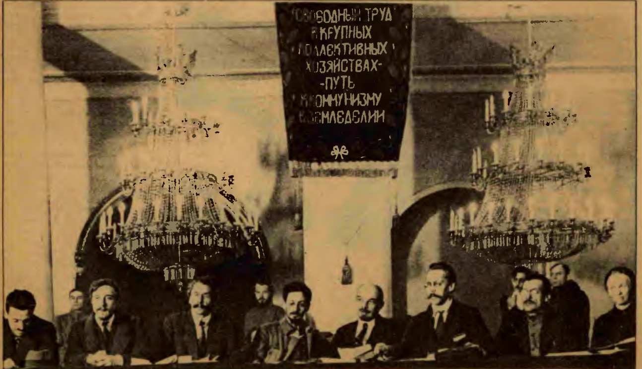
Lenin ve Sverdlov, 11 Aralık 1918

"Ehveni şer" ya da Türkçesiyle "kötünün iyisi" denen mantık, gerçekte kötünün gelmesine yardımcı olur. CHP AP'den, MHP'den daha az kötüdür, öyleyse var gücü onu destekleyelim mantığı, AP'yi, MHP'yi güçlendirir. Lenin bu ger-